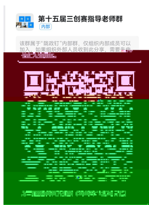
第十五届三创赛指导教师群